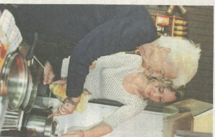
Das Team von cura domo weiß, worauf es in der Betreuung ankommt.

Cura domo bietet entsprechend dem Betreuungsbedarf unterschiedliche Betreuungspakete an – über die Tagesbetreuung bis hin zur klassischen 24-Stunden-Betreuung. Dabei kommt eine erfahrene Betreuungskraft vier Stunden oder den ganzen Tag in die Wohnung bzw. in das Haus der zu betreuenden Person und übernimmt – nach Vorgabe – die allgemeine Hausführung, hilft bei der Körperhygiene und beim Zubereiten von Mahlzeiten. Sie leistet Gesellschaft, ohne auf die Ursachen zu müssen, weil bereits der nächste Klient wartet.